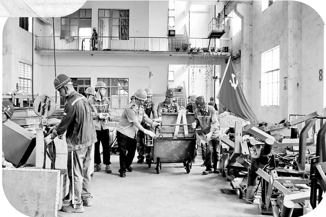
近期台风、暴雨等极端天气频发,7月14日,花山抽蓄公司两个支部联合开展“防台度汛”主题党日活动,以实际行动筑牢安全防线,彰显支部党员责任与担当,推动党建与安全生产深度融合,为项目安全度汛保驾护航。