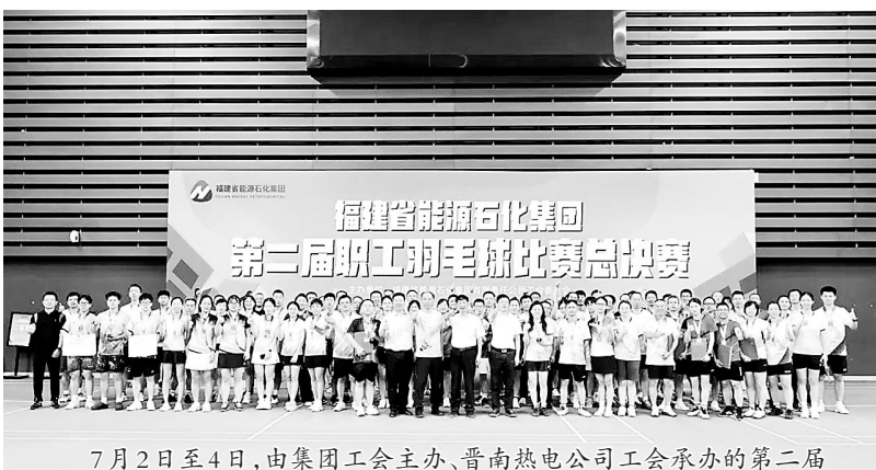
7月2日至4日,由集团工会主办、晋南热电公司工会承办的第二届职工羽毛球总决赛在晋江第二体育中心圆满收官。最终决出混合团体、男单、男双、女单、女双、混双等六个项目的一、二、三等奖。

从“单向推动”到“双向赋能”,从“点状探索”到“体系成形”,晋南热电党总支以“双轮驱动”机制带动党建与业务深度融合,不断拓展组织力、凝聚力与执行力,激发高质量发展的澎湃动能。(杜剑涛)