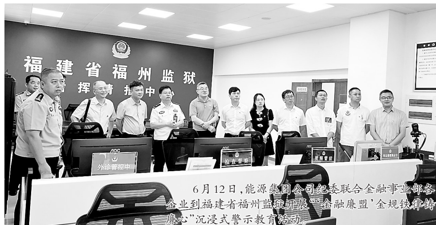
6月12日,能源集团公司纪委联合金融事业部各企业到福建省福州监狱开展“金融联盟”金规铁律铸廉心”沉浸式警示教育活动。