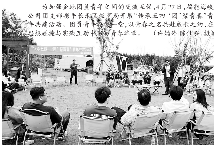
为加强企地团员青年之间的交流互促，4月27日，福能海峡公司团支部携手长乐区教育局开展“传承五四‘团’聚青春”青年共建活动。团员青年齐聚一堂，以青春之名共赴成长之约，在思想碰撞与实践互动中书写青春华章。