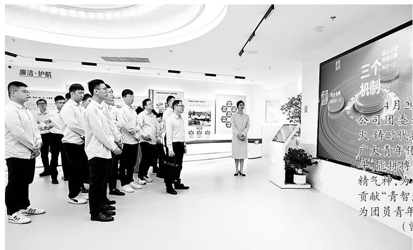
4月29日，福能新能源公司团委开展“以青春之火铸时代担当”活动，鼓舞广大青年传承能化人“能战、能拼、能搏、能奉献”的昂扬精气神，为公司高质量发展贡献“青智慧、青力量”。图为团员青年参观集团展厅。