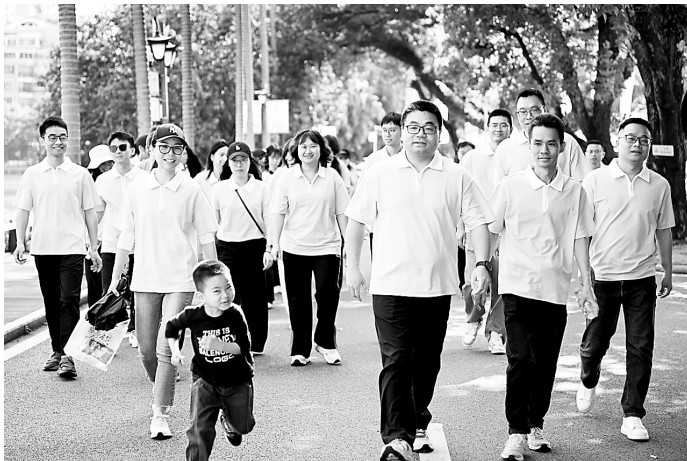
4月29日，华夏设计院公司团委开展“青力青为 健行未来”主题团日活动，激励青年干部职工以昂扬姿态投身工作，勇担时代使命。图为青年干部和团员青年在西湖公园开展健步走活动。