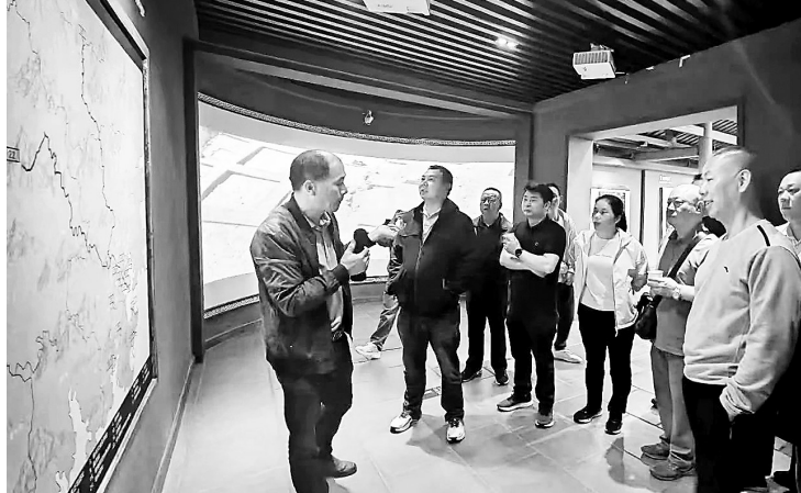
在“五一”国际劳动节来临之际，永安煤业公司选派2名劳模工匠代表前往安溪县，参加大田县总工会举办的劳模工匠学习交流交流活动。