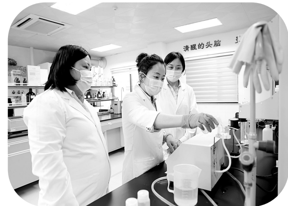
图为化验员严格依照流程进行测硅实验的各项步骤