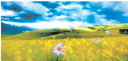
大好河山