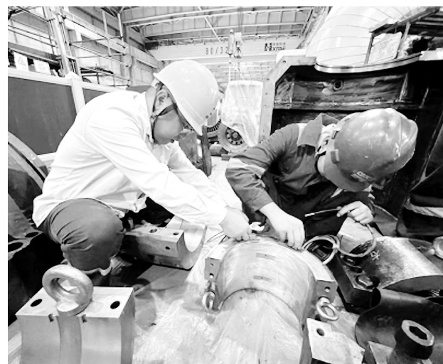
近日，福能贵电#1机组A修正有序进行中，该公司设备管理部各专业分工明确、各司其职，提前策划部署，稳步推进检修工作。