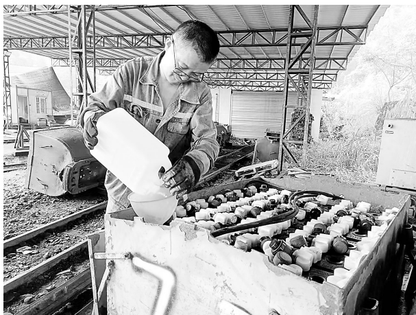
▲ 福建煤电公司箭竹坪煤矿开展机修“限时”服务活动，通过加强对机修人员的设备维修时间考核，确保设备在规定的时间内维修完成并投入生产使用。图为近日，该矿机运人员正在机修车间紧张有序地维护矿用电瓶车。

本报讯 近日，鸿山热电公司组织相关部门对厂内光伏项目EPC招标技术规范书进行评审。各评审人员对《技术规范书》进行了细致的审阅与深入讨论，并针对《技术规范书》相关内容提出了宝贵的意见和建议。经过充分的交流和讨论，《技术规范书》已顺利通过各部门内部评审。（杨臻）