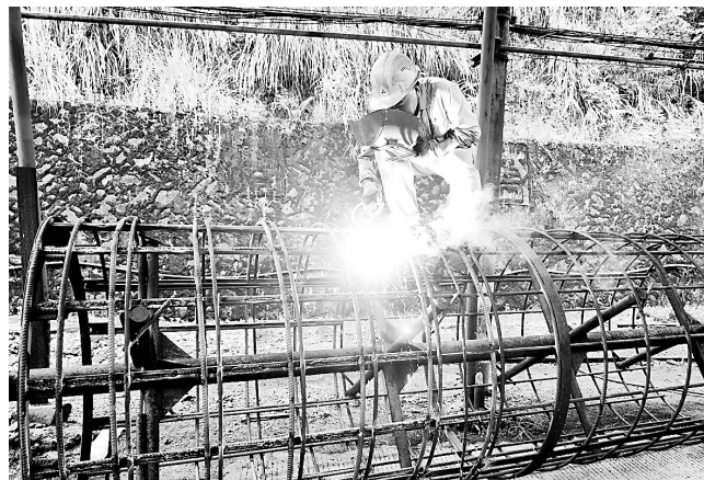
▲ 永安煤业公司加福筛选厂积极推进生产系统搬迁技改项目，加大降本增效措施，力争实现减亏控亏目标。图为9月3日，该公司机修人员对即将投入生产系统搬迁技改项目使用的旧滚筒筛、旧配电柜进行维修更新。