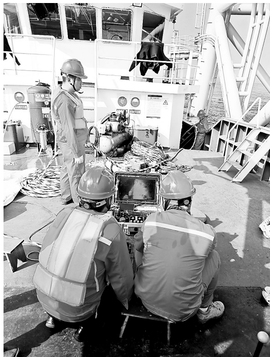
福能保险经纪公司全面参与集团及权属企业风险全流程管理。图为8月29日~9月1日,该公司协调组织各承保保险公司、技术服务公司对福能海峡长乐外海海上风电场C区进行风险查勘服务。

福能股份将锚定绿色能源新战略,争当新型电力系统主力军。力争2025年末控股运营、建设发电装机规模达1500万千瓦,2030年末控股运营、建设发电装机规模达2000万千瓦,为推动中国能源绿色低碳转型贡献力量。(福能股份)