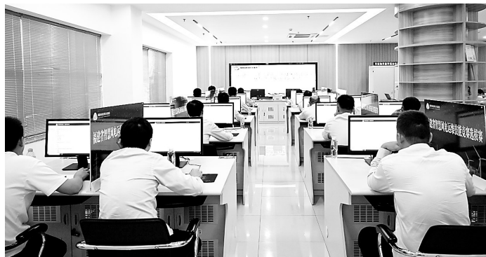
8月29日,福建省新能源智慧风电运行维护技能竞赛集团选拔赛圆满落幕。此次技能选拔赛由福能新能源公司承办,来自福能新能源、三川风电、福能海峡和晋江气电等4家单位的24名选手同台竞技。图为理论知识比赛现场。