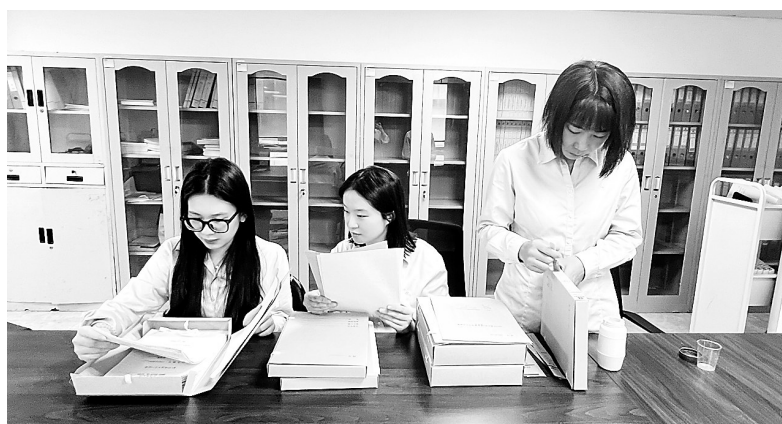
6月7日,晋南热电公司以“筑梦现代化 奋斗兰台人”为主题开展2024年国际档案日系列宣传活动。在档案员的悉心指导下,该公司职工体验了文件装订整理的细致过程,感受档案工作的严谨与不易。