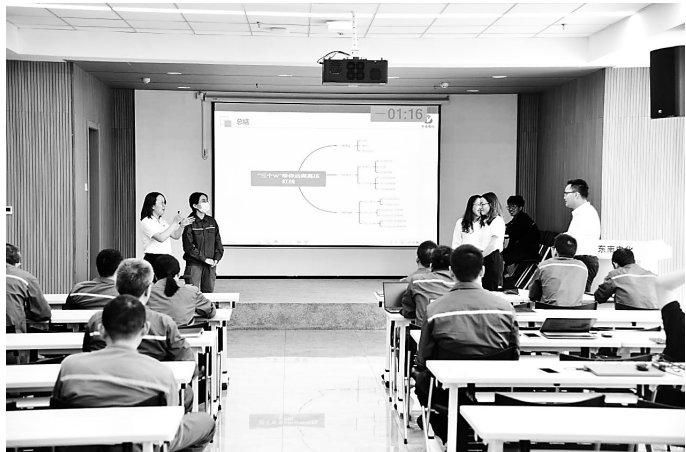
6月4日,东南电化公司举行首届内训师竞聘大赛,为公司选拔一批优秀的内训师,进一步推动公司内部培训工作深入开展。大赛分为技能组、管理组、技术组三个类别,共有31名技能人员、10名专员、18名工程师参与竞聘。