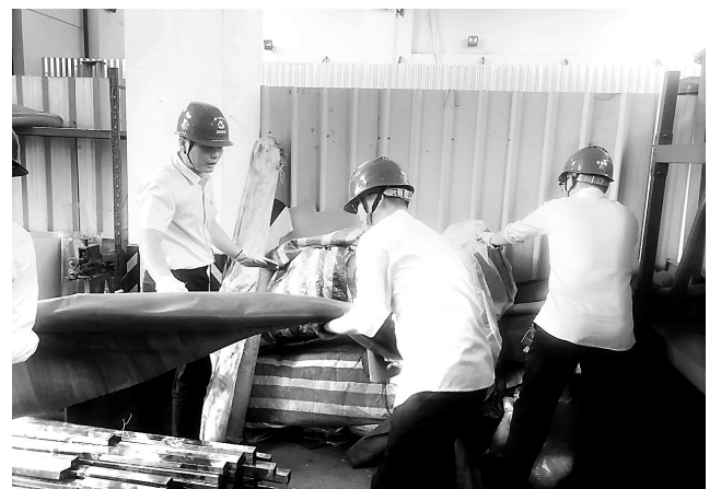
▲ 近日,龙安热电公司设备管理党支部开展了“真诚主动送服务,助力运维管理工作提升”主题党日活动。图为支部党员对检修楼死角处堆放的地垫、配件、工器具进行集中清理归类。