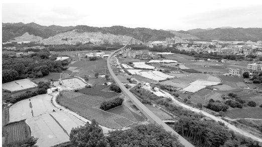
图为龙海机制砂项目运输廊道航拍图

今年以来,新材公司权属漳州公司以深化拓展“三争”行动为抓手,以提质增效为基础,锚定目标、真抓实干,铆足干劲、铆足干劲、铆足干劲,鼓起争优、争先、争效的冲刺状态,助推公司高质量发展破局起势。