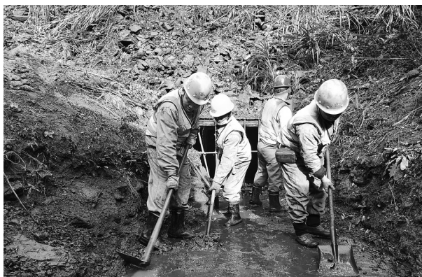
永安煤业公司西洋筛选厂加强现场环保治理,做好特殊天气防扬尘、雨污分流、污水循环再利用,人工洒水降尘、喷雾设施防尘相结合,切实做到达标排放。图为近日,该厂组织职工对排水沟进行清理整治。