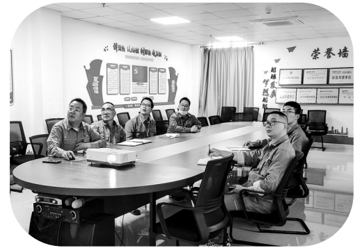
图为HSE团队学习相关典型环保违法案例