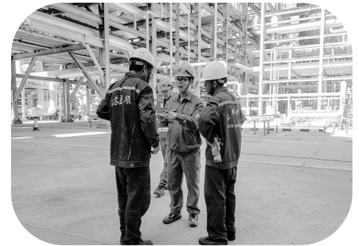
图为HSE团队安全工程师开展承包商作业安全现场检查及教育

HSE团队结合实际情况,通过OA、微信群及时发布新冠防治全流程、个人防护指南、阳性人员转阴后注意事项等文件加强宣导,通过强化个人防护、优化人员管控、落实疫情防控物资储备等措施,避免发生聚集性疫情,保证了公司在疫情期间的稳定运行。