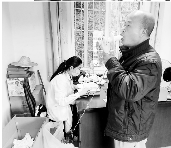
◀ 为进一步了解职工职业病发展现状，近日，永安煤业公司仙亭煤矿邀请大田县总医院医护人员到该矿为职工进行肺功能检查。