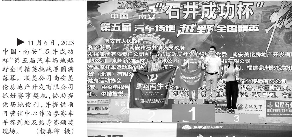
▶ 11月6日，2023中国·南安“石井成功杯”第五届汽车场地越野全国精英挑战赛圆满落幕。联美公司南安美伦房地产开发有限公司抓好赛事契机，协助提供场地便利，并提供项目营销中心作为参赛选手签到处及热身赛颁奖现场。