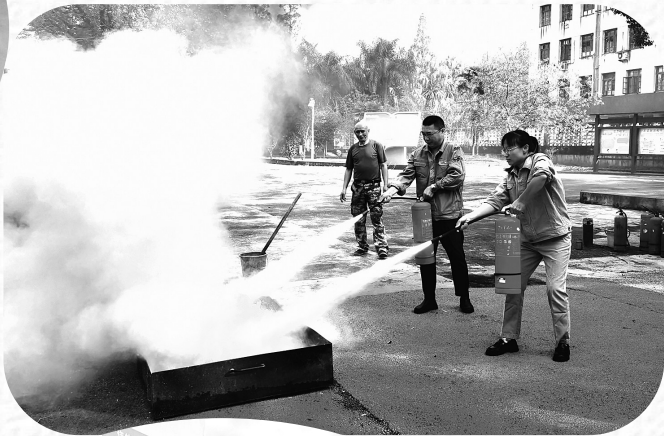
▲11月9日,福维公司党群支部组织开展了“学消防、懂消防、会应急”主题党日,让党员通过消防灭火锻炼、紧急救护常识培训,进一步提高消防和自救互救的实操能力。