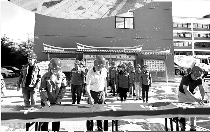
▶11月8日上午,建材控股厦门混凝土公司围绕“预防为主,生命至上”消防宣传月活动主题,组织职工开展消防安全签名和消防灭火演练活动。