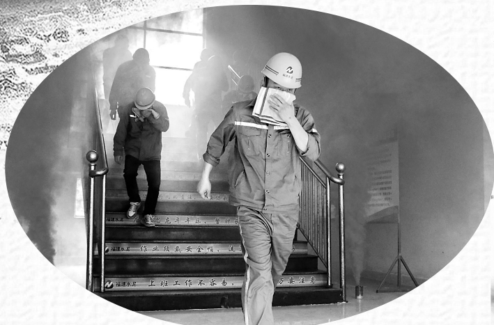
▲11月9日,永安建福公司、金银湖水泥公司在永安建福熟料分厂中控楼开展“119”消防安全紧急疏散演练,共有26名员工参加了演练。

今年11月9日是第32个全国消防日,每年的11月为全国消防宣传月。结合本次消防月“预防为主,生命至上”的主题,能化集团各权属企业开展了内容丰富、形式多样的消防安全活动,进一步增强职工的风险防范、消防安全应急意识和自救互救能力。