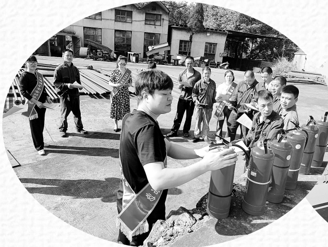
▲11月9日上午,福建煤电公司龙潭煤矿通过悬挂横幅、张贴活动海报、发放宣传单、现场讲解灭火器的使用方法等形式,开展第32个全国消防日活动。图为工作人员正在给职工讲解灭火器的使用方法。