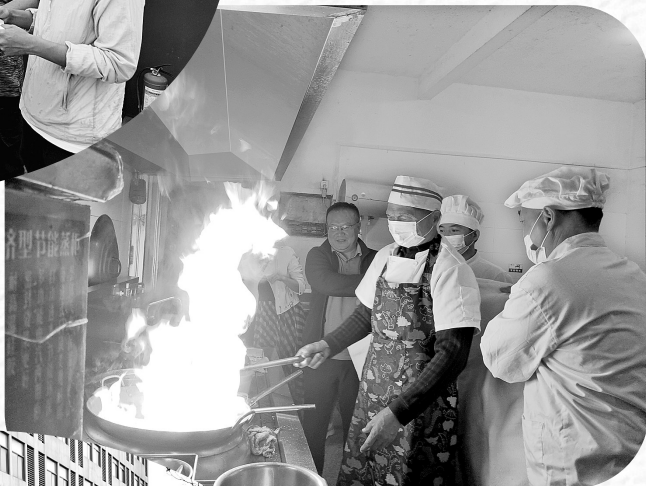
▶11月13日,永安煤业公司物业分公司在机关食堂开展了消防演练活动。图为安全管理员正在示范油锅起火的处理方法。