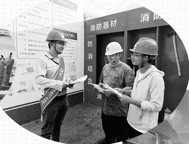
▲11月9日,联美公司德化许厝第二工程项目部成立安全宣传小组,深入施工现场,以“预防为主,生命至上”为主题,以“电气焊作业安全操作及临时用电安全”为重点开展精准消防宣传教育活动,切实把消防安全知识传播到每位参建人员。