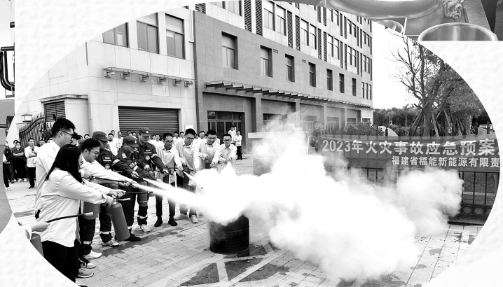
▲11月8日下午,在第32个全国消防日来临之际,福能新能源公司联合四川风电公司在后勤保障基地大楼开展火灾事故应急演练。