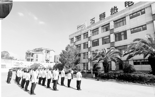
10月1日,石狮热电公司在综合办公楼前举行隆重的升旗仪式,庆祝中华人民共和国成立74周年。