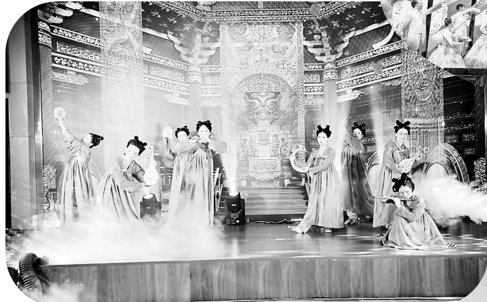
近日,联美公司“学思践悟感党恩 唱响联美和谐曲”歌唱比赛在厦门市闽南大剧院举行。公司通过举办歌唱比赛的形式,凝心聚力推进企业高质量发展,以优异的成绩庆祝中华人民共和国成立74周年。