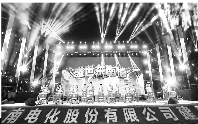
近日,东南电化公司举办“盛世华章 逐梦东南”文艺汇演,庆祝中秋、国庆两节和建厂65周年。