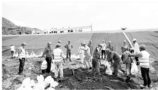
▲为做好2023年防汛抗旱工作要求,福能贵电公司于8月31日举办了“2023年灰场防洪、防垮坝事故应急演练”。图为演练现场。