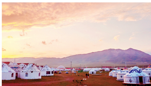
游牧人家