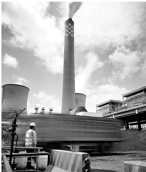
福能(贵州)发电有限公司7月23日单日接卸量突破1.7万吨,创下福能贵电投产以来单日接卸量的又一新高。

虚拟化项目的改造提升了ERP系统的运维效率,补丁维护停机时间减少50%,后台任务运行锁定时间降低了50%。(何心振)