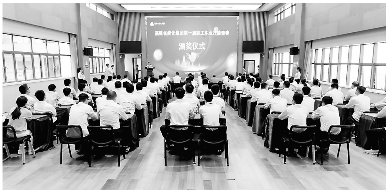
10月27日,由省总工会和能化集团共同举办、福能股份公司承办、福能新能源公司协办的能化集团第一届职工职业技能竞赛电力安全技术、继电保护、运行值班员、电力机械设备检修四个项目圆满落幕。当天的颁奖仪式在福能新能源公司八楼多功能厅举行,各参赛单位的领队及参赛选手出席了颁奖仪式。

贸易商们表示通过本次交流会,充分了解了东南电化的发展历程,对东南电化的未来更加充满信心。(陶泓羽)